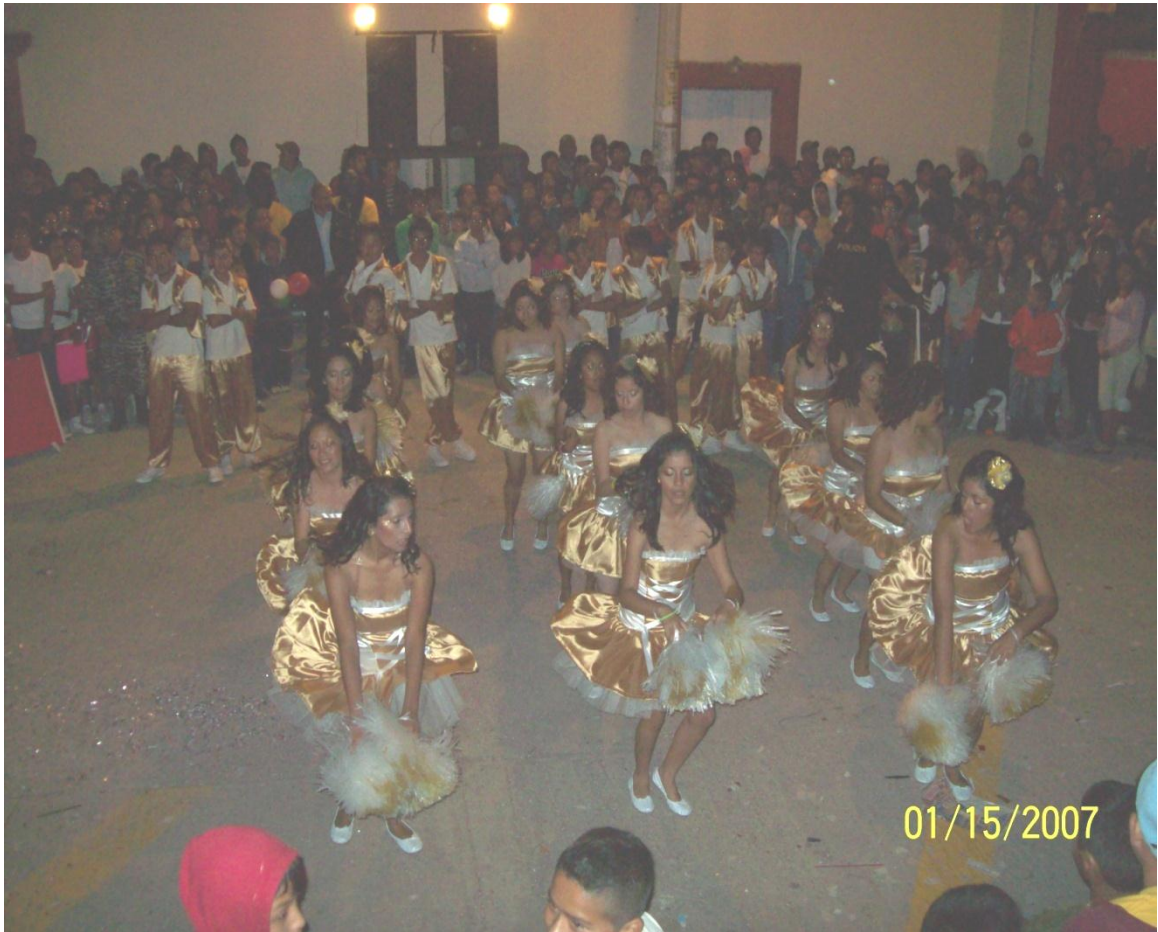
TEATRO DE LA FEREMA